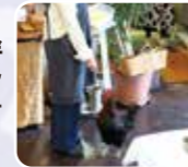
人を怖がらない鶏 しかもチーズが好物

なぜか鶏も出迎えてくれるカフェはワンちゃんと同僚もOK。フ子田舎体験ランチやピザ、カレー、スイーツと全て手作りです。そんな波輝カフェの目の前にはすぐ海があり、時を忘れるほどゆったりできます。