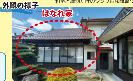
外装は壁も少なくアルミサッシではありません 大きな木枠の窓でした