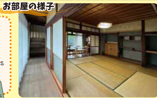
55年前のお部屋は、やはり和室空間 和室と縁側だけのシンプルな間取り