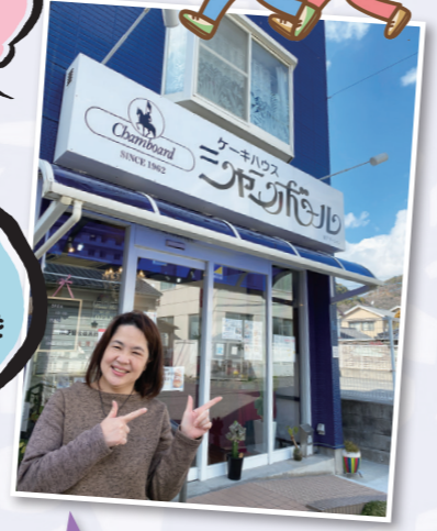
ネイビーの外観にホワイトのお店看板が映えます♪