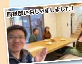
佃様邸におじゃましました!