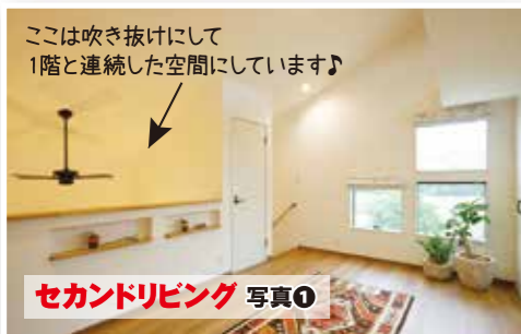
セカンドリビング 写真①