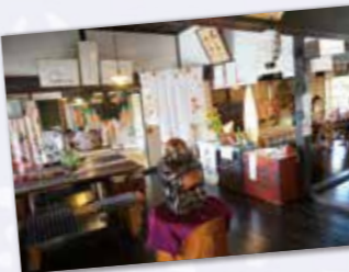
▲座敷わらしが出てきそうな雰囲気☆