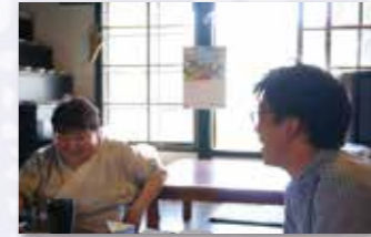
▲人を惹きつける魅力たっぷりの女将さん