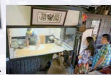
そば打ちが見れちゃいます▶