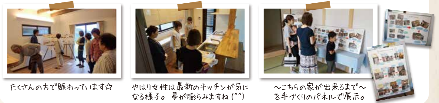
たくさんの方で賑わっています☆