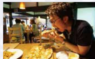
おいしい〜(*^^)v 昭和の時代にタイムスリップしたような空間で懐かしさを感じながら...