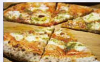
生地は厚めのモチモチ食感のピザ☆

田舎にありがちな問題といえば空き家住宅や耕作放棄地ですが...。こちらの世羅町の「おへそカフェ」は築160年の古民家を改装して営業されています。耕作放棄地を手入れて作った自家製の小麦と地元の野菜を使った石窯ピザがあり、スペイン料理も食べられます。BGMのジャズと自然を感じながらゆったりとした時間を過ごせます。職業柄、古民家再生にも興味があり、実際に見てみよう!と思い、伺って以来のお付き合いですが、いつも満席(◎◎)! 特に土・日・祝は予約要!!