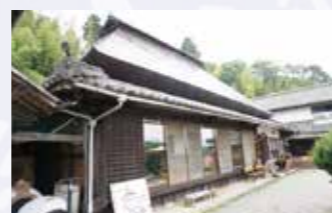
こちらが「おへそカフェ」