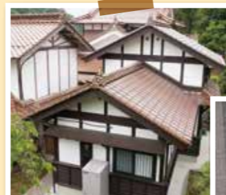
お施主様のこだわりを実現した和風の外観