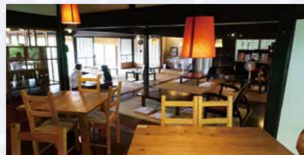
昔ながらの「田の字」に和室が並んでいます。黒くツヤのある柱等は長年磨かれてきた証。