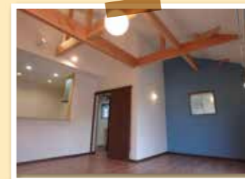
リビング、ダイニングは傾斜天井で開放感のある造りに。