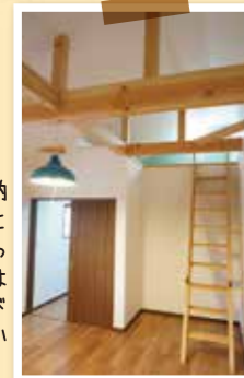
少しでも収納スペースにと寝室用に作ったロフト。今はお子様の遊び場になっちゃいました(^_^)