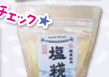
塩糀に加工した物も販売されています。