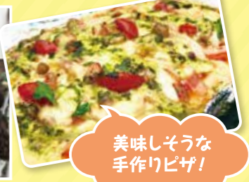
美味しそうな手作りピザ!