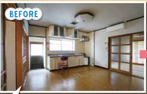
時代を感じてしまうキッチン空間とフローリング