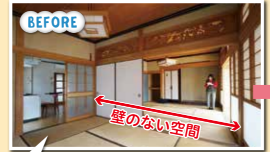
昔はこの襖を取って大空間にして、家で冠婚葬祭をしてましたね。