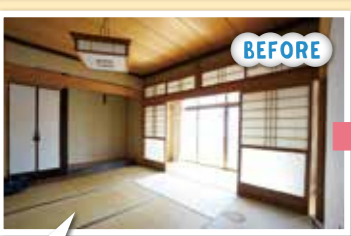
8帖部屋を6帖和室に変え、タタミは正方形の琉球タタミに