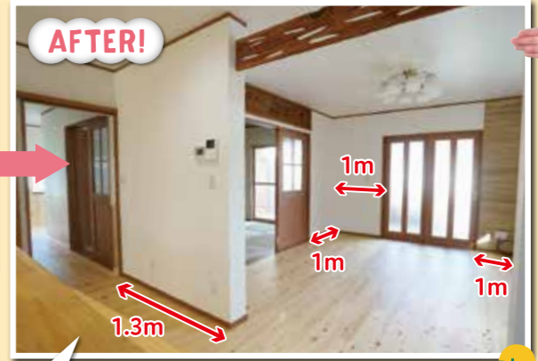
ガラス戸が減り、部屋が暗くなる不安が出ますが、それを考慮し床材を白く明るいモノに。